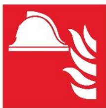
Godkendt skilt 105x105 mm

Nøglebokse/nøglerør skal placeres i umiddelbar nærhed af den adgangsmulighed, som de betjener, og de skal være tydeligt markeret med et skilt.