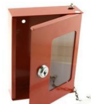
Figur 1, Nøgleboks ved ABA central med nøgle for betjening

Nøgle for betjening af ABA central skal være placeret i en aflåst nøgleboks, eksempelvis som vist på figur 1, for at undgå utilsigtet afbrydelse af varsling, samt for at sikre mod reetablering af ABA anlæg uden Nordvestjyllands Brandvæsen accept. Øvrige løsninger skal godkendes af Nordvestjyllands Brandvæsen.